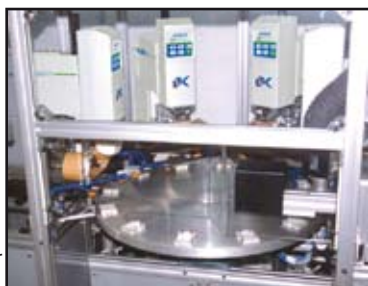
Alien sur plateau tournant