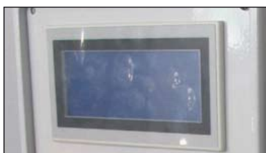
Automate à touches sensibles