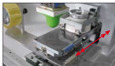
Entrée/Sortie plateforme (Auto-nettoyage en dessous)